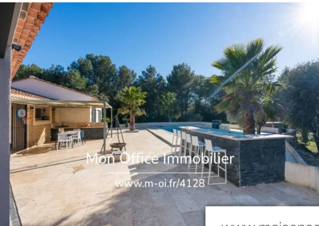
Mon Office Immobilier www.m-oi.fr/4128