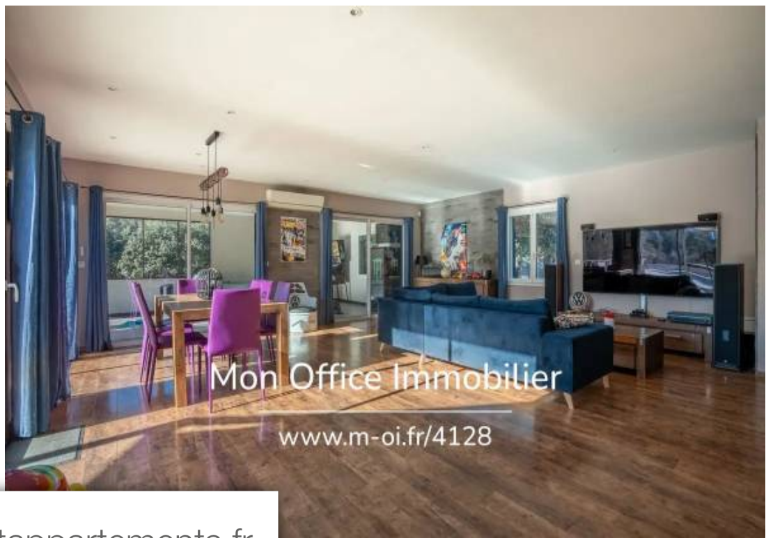
Mon Office Immobilier www.m-oi.fr/4128