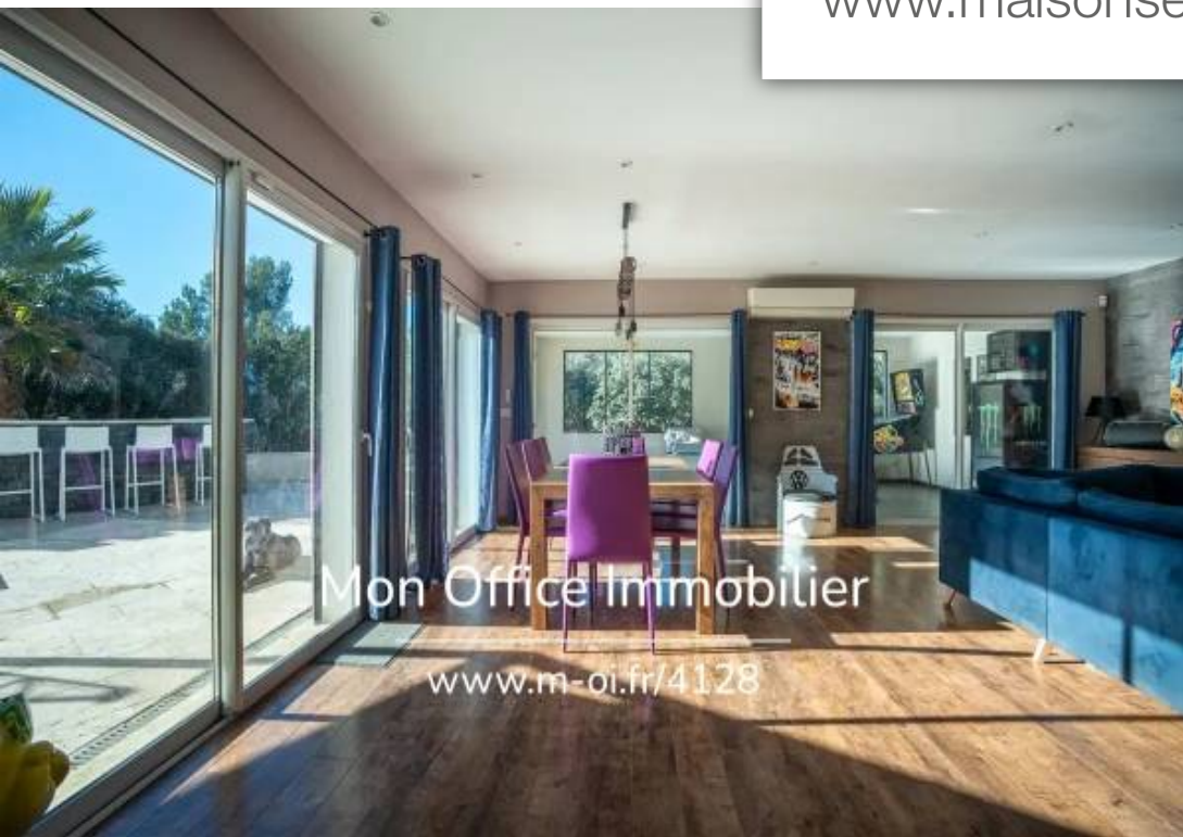
Mon Office Immobilier www.m-oi.fr/4128