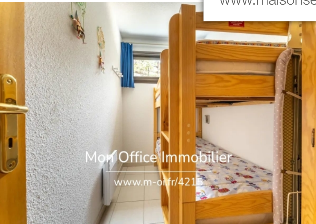
Mon Office Immobilier www.m-oi.fr/4215