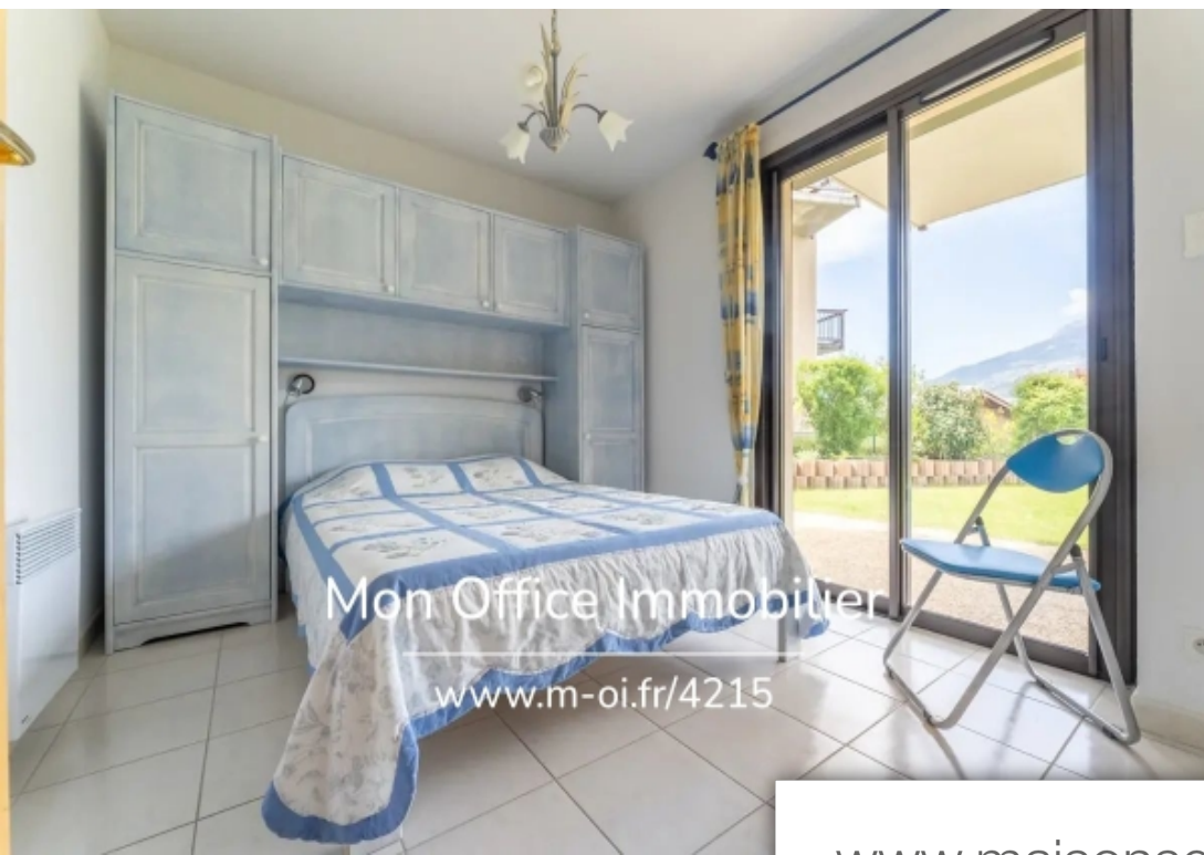
Mon Office Immobilier www.m-oi.fr/4215