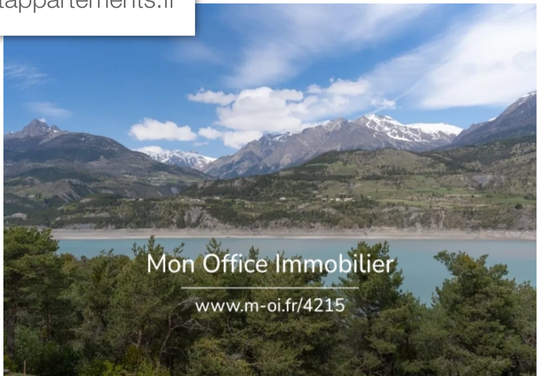
Mon Office Immobilier www.m-oi.fr/4215